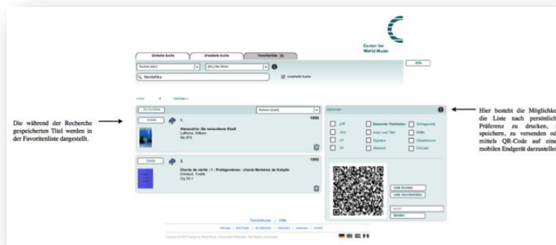
Abb.2: Favoritenliste (Bittner 2012)